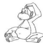
Club des Jeunes Hagen - Kleinbettingen